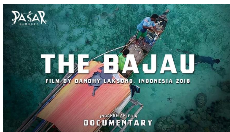
(Gambar 5. Poster Film The Bajau 2018)