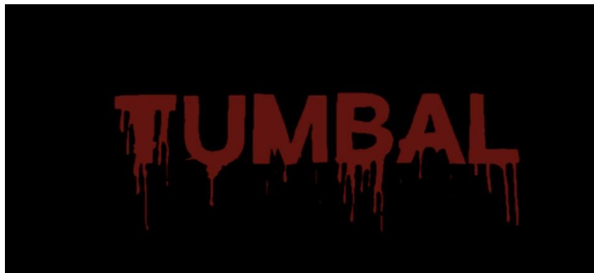
(Gambar 1.6. Poster Film Tumbal 2020)