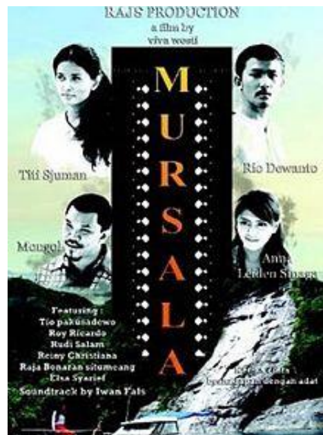
(Gambar 1.2. Poster Film Mursala)

( Sumber : https://images.app.goo.gl/4LnrAUYThTCL5xYQ9 , diakses pada 26 maret 2021. 22.00 wib )