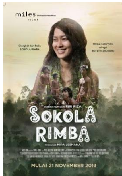
( Gambar 1.1 Poster Film SOkola Rimba )