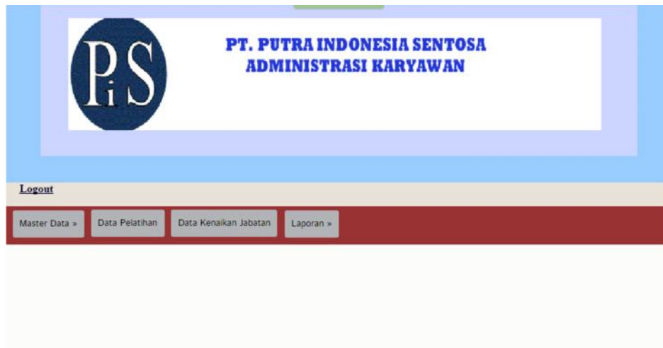
Gambar IV.2. Tampilan Form Data Utama