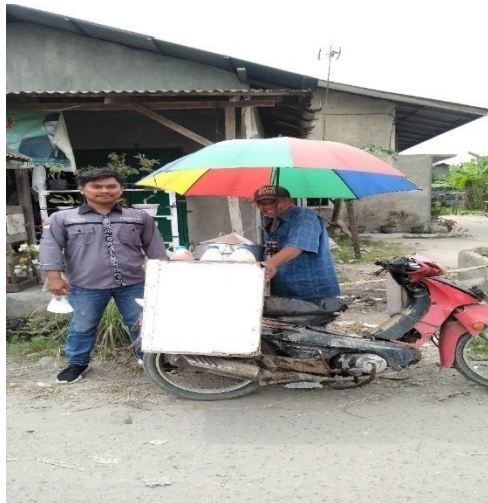
Gambar 4.4 Dokumentasi dari hasil wawancara dengan mustahik