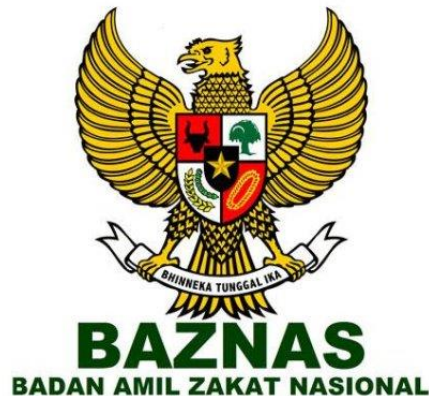
Gambar 4.2 Logo Badan Amil Zakat Nasional

Logo BAZNAS terdiri dari Lambang Burung Garuda Pancasila dengan tulisan BAZANAS di bawahnya dan Badan Amil Zakat Nasional.