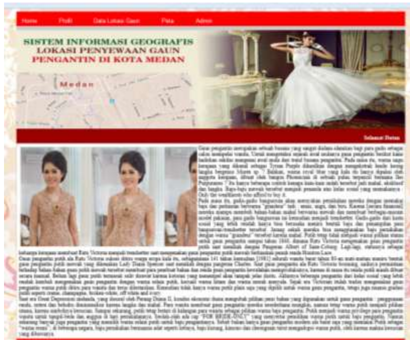
Gambar IV.2. Tampilan Form Profil

Tampilan form untuk melihat Profil. Dalam tampilan ini memberikan informasi tentang profil Lokasi Penyewaan Gaun Pengantin di Kota Medan dan Kota Medan yang ditampilkan pada gambar IV.2 :