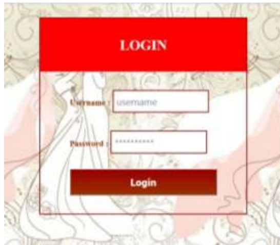
Gambar IV.5. Tampilan Halaman Admin

Tampilan form login Admin ini berfungsi menginputkan data Admin dengan mengisi Username dan Password yang sesuai kemudian klik tombol masuk. Adapun tampilan form login tersebut dapat dilihat pada gambar IV.5: