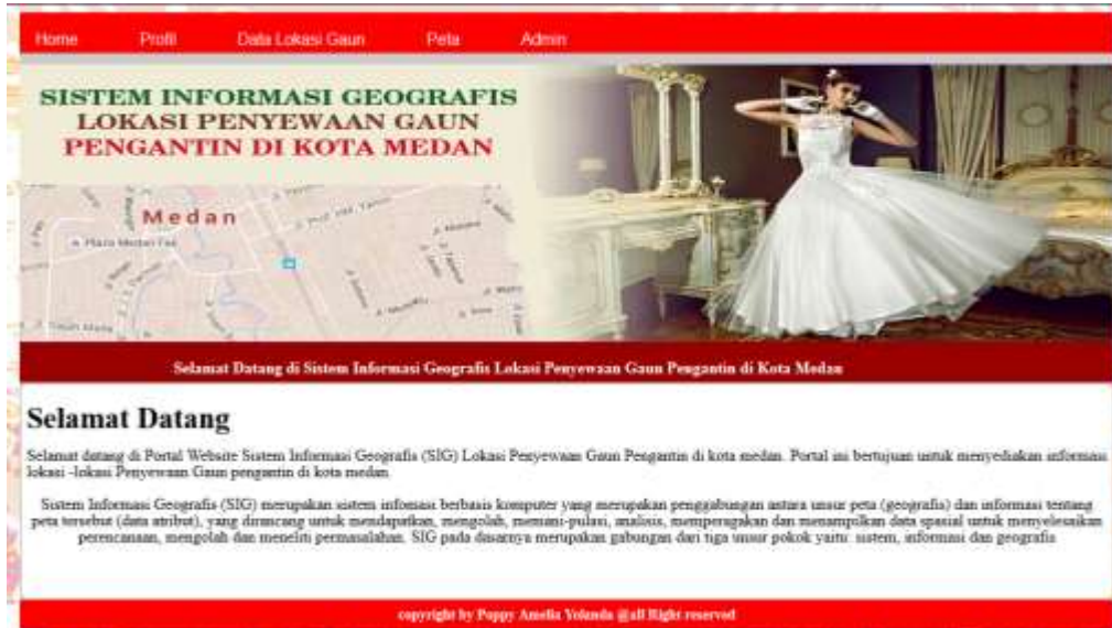
Gambar IV.1. Tampilan Awal Sistem Informasi Geografis Lokasi Penyewaan Gaun Pengantin

Tampilan form proses untuk melihat Home atau tampilan awal pada sistem yang memberikan informasi Sistem Informasi Geografis yang ditampilkan pada gambar IV.1: