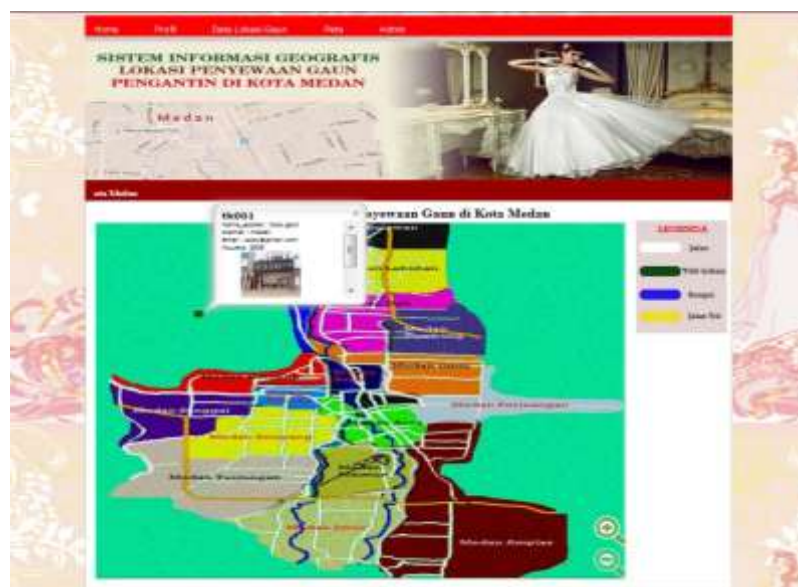
Gambar IV.4. Tampilan Form Peta

Tampilan form untuk melihat Peta. Dalam tampilan ini memberikan informasi berupa peta letak Lokasi Penyewaan Gaun Pengantin di Kota Medan yang ditampilkan pada gambar IV.4: