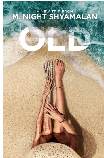
Gambar. 2. Poster Film Old