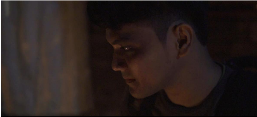
Gambar IV.8 Scene 7 Pada Film “Saudara Sedarah”

Ekspresi Visual dan Pencahayaan ialah penyutradaraan penceritaan terbatas juga melibatkan penggunaan pencahayaan, warna, dan visual lainnya untuk menggambarkan perasaan dan suasana hati karakter. Warna dan pencahayaan dapat digunakan untuk menciptakan suasana yang sesuai dengan perasaan karakter pada saat tertentu (Arbani Abdurohman Annas, Terbitan: 2018).