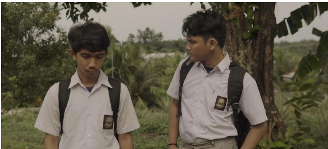
Gambar IV.4 Scene 4 Pada Film “Saudara Sedarah”

Narator atau penulis hanya memberikan wawasan ke dalam pikiran dan perasaan karakter utama atau beberapa karakter tertentu. Ini memungkinkan pembaca untuk mendapatkan pemahaman mendalam tentang dunia cerita dari perspektif karakter yang terlibat. Selain itu, perubahan tempo yang teratur dapat menarik penonton dan menyoroti momen-momen penting dalam cerita. Penggunaan tempo aktor dengan bijaksana membantu menciptakan suasana yang mendalam dan memberikan pengalaman sinematik yang mengesankan, mengajak penonton masuk ke dalam dunia karakter dan ikut merasakan perasaan yang sedang dialami, sehingga meningkatkan daya tarik dan dampak dramatis film secara keseluruhan.