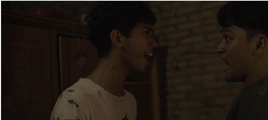
Gambar IV.15 Scene 13 Pada Film “Saudara Sedarah”

Penceritaan terbatas memungkinkan penulis untuk lebih mendalam dalam mengembangkan karakter utama. Dengan fokus pada pikiran dan perasaan karakter, penulis dapat menggambarkan perubahan emosional, pertumbuhan, dan perjalanan karakter dengan lebih rinci.