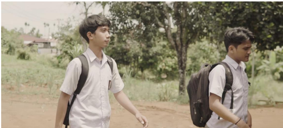
Gambar IV.21 Scene 11 Pada Film “Saudara Sedarah”