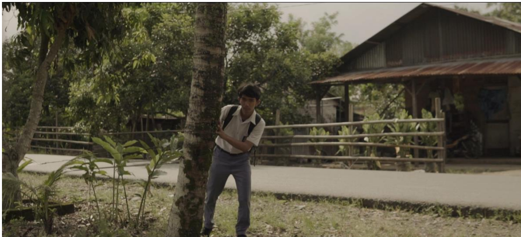
Gambar IV.1 Scene 5 Pada Film “Saudara Sedarah”

Penceritaan terbatas, juga dikenal sebagai sudut pandang terbatas, adalah salah satu teknik penceritaan dalam sastra yang membatasi sudut pandang narator hanya pada pikiran, perasaan, dan pengalaman karakter tertentu dalam cerita. Dalam penceritaan terbatas, pembaca hanya dapat mengetahui apa yang dirasakan dan dipikirkan oleh karakter yang menjadi fokus sudut pandang tersebut. Ini berbeda dengan penceritaan orang ketiga yang lebih objektif dan dapat mencakup pemahaman tentang berbagai karakter.