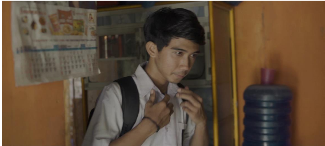
Gambar IV.16 Scene 2 Pada Film “Saudara Sedarah”