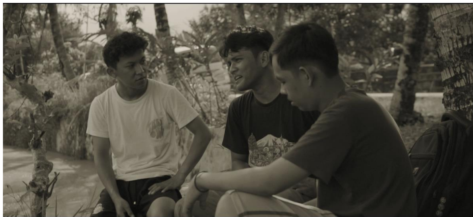
Gambar IV.24 Scene 16 Pada Film “Saudara Sedarah”