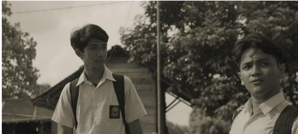
Gambar IV.23 Scene 16 Pada Film “Saudara Sedarah” (Sumber: Muhammad Reva Andrew)