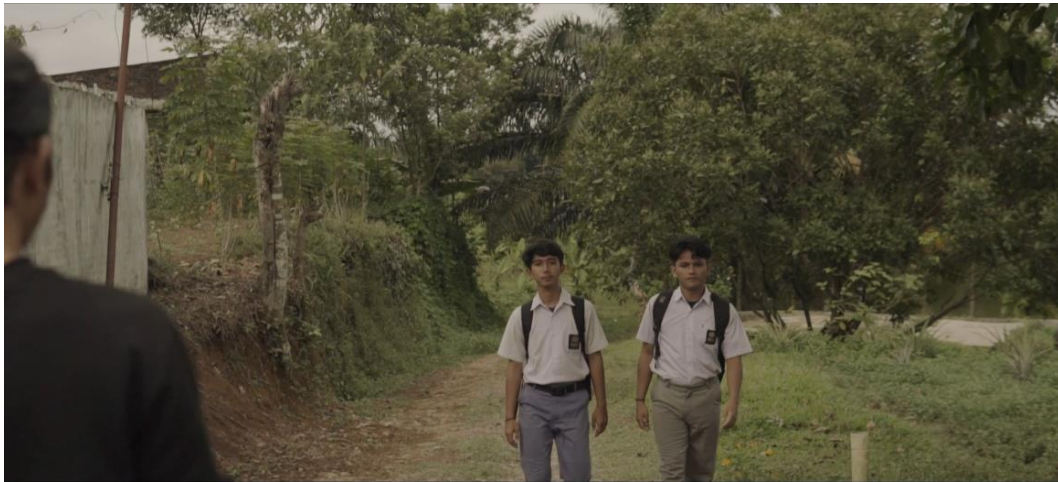
Gambar IV.25 Scene 2 Pada Film “Saudara Sedarah”

Ketika ada transisi antara sudut pandang karakter yang berbeda, sutradara harus memastikan bahwa perubahan ini tidak menyebabkan kebingungan atau gangguan dalam narasi. Teknik seperti transisi halus atau perbedaan yang jelas dalam penyuntingan dapat membantu menjaga kelancaran cerita (Aristia Maryamah, Nancy Terbitan: 2020).