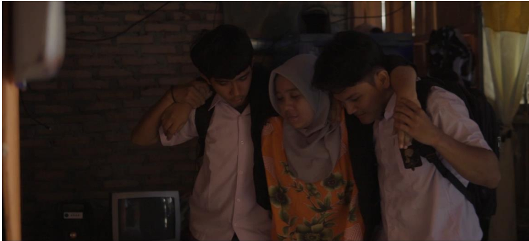
Gambar IV.10 Scene 11 Pada Film “Saudara Sedarah”