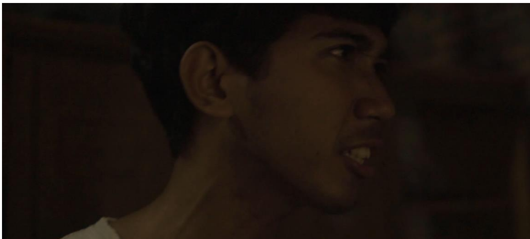
Gambar IV.13 Scene 13 Pada Film “Saudara Sedarah”

Pergerakan kamera track out handheld ini berhasil menciptakan momen yang menggetarkan hati dan membawa penonton ikut merasakan situasi duka yang dihadapi oleh Indra, menjadikan adegan tersebut semakin dramatis dan mengesankan.