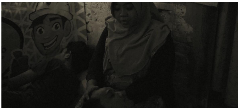
Gambar IV.10 Scene 19 Pada Film “Saudara Sedarah”