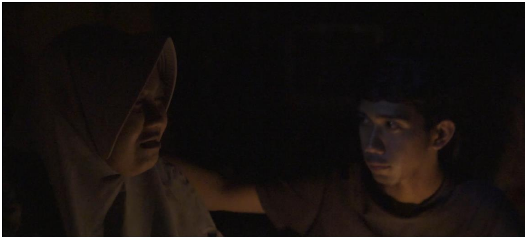
Gambar IV.7 Scene 7 Pada Film “Saudara Sedarah”

Dengan terbatasnya wawasan narator, pembaca cenderung merasa lebih terhubung dengan karakter yang menjadi fokus. Mereka bisa merasakan emosi, dilema, dan pengalaman karakter secara lebih intens, karena mereka berada dalam pikiran karakter.