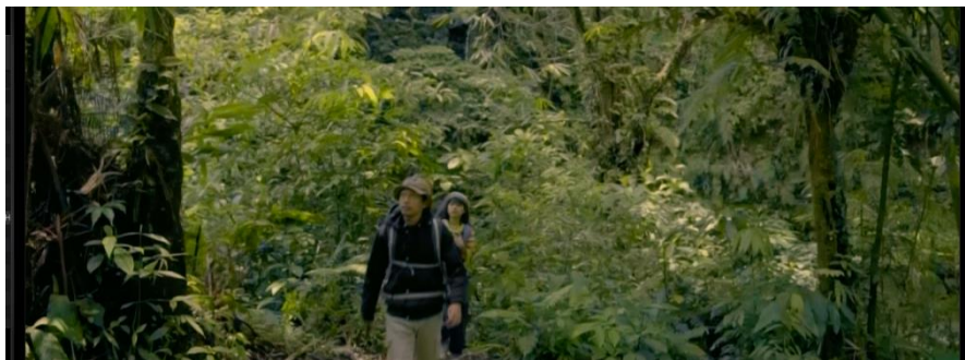
Gambar IV.18 SCENE 16 Pada Film “Kanvas Terakhir”

Mise-en-scene adalah konsep dan praktik penting dalam perfilman, teater, dan seni visual lainnya, yang mengacu pada pengaturan dan penempatan elemen-elemen visual dalam adegan atau frame.