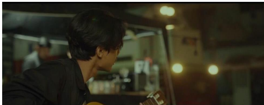
Gambar IV.16 SCENE 7 Pada Film “Kanvas Terakhir”

Mise-en-scene adalah konsep dan praktik penting dalam perfilman, teater, dan seni visual lainnya, yang mengacu pada pengaturan dan penempatan elemen-elemen visual dalam adegan atau frame. Ini mencakup pencahayaan, setting atau latar belakang, kostum, makeup, tatanan rambut, gerakan dan posisi aktor, serta komposisi frame kamera. Melalui mise-en-scène , sutradara dan tim produksi dapat menciptakan atmosfer, suasana, dan estetika yang sesuai dengan cerita yang ingin disampaikan.