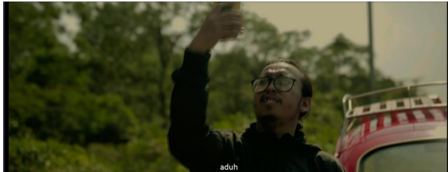
Gambar IV.8 SCENE 12 Pada Film “Kanvas Terakhir”

sehingga menciptakan pengalaman yang menakutkan dan mempengaruhi perasaan mereka selama menonton film.