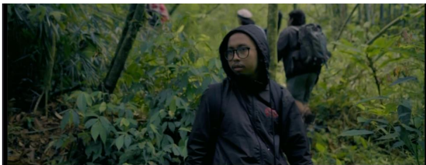
Gambar IV.10 SCENE 15 Pada Film “Kanvas Terakhir”

Eksresi tara memperlihatkan ritme rasa takut yang terjadi karena mereka merasa ketika memasuki hutan itu semakin kedalam semakin aneh. Dengan gemetar, dia mengambil daun berbentuk aneh yang tak pernah dia lihat sebelumnya, dan ekspresi ketidakpercayaannya tercermin di wajahnya. Dengan ragu, dia menyebutkan bahwa mereka mungkin telah tersesat, mengingat rasa tidak kenalnya dengan lingkungan ini dan objek aneh yang mereka temui. Daun tersebut menjadi simbol pertama dari kebingungannya dan menandai awal dari perjalanan yang penuh ketidakpastian dan ketakutan saat mereka mencoba mencari jalan keluar dari hutan yang semakin mencekam.