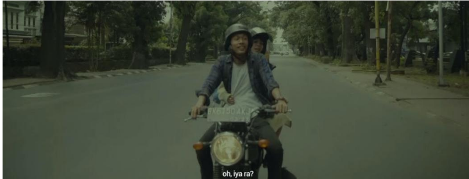
Gambar IV.21 SCENE 4 Pada Film “Kanvas Terakhir”

Kaluna, dan Jaka, menjadikan adegan tersebut semakin dramatis dan mengesankan.