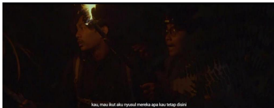
Gambar IV.14 SCENE 27 Pada Film “Kanvas Terakhir”

Tara dan Napi berdiri di tengah hutan yang gelap pada malam hari, memegang erat obor yang menjadi satu-satunya sumber cahaya. Wajah mereka penuh ketakutan, dan suasana hutan yang sunyi semakin menambah ketegangan di udara. Dalam tempo gerak awal yang perlahan, mereka meraba setiap langkah