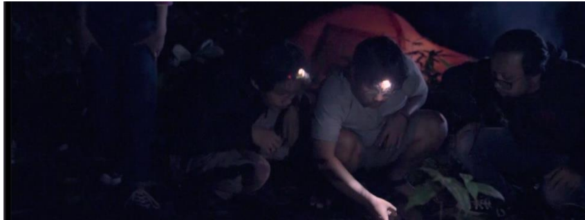
Gambar IV.7 SCENE 29 Pada Film “Kanvas Terakhir”

Dalam adegan di atas terlihat ritme gerakan mereka yang menunduk dan melihat sebuah jejak misterius yang berada di sana. Cahaya gemerlap bulan hanya sedikit menerangi jejak tersebut, menciptakan aura misteri yang mencekam di sekitar mereka. Hat-hat mereka berdebar kencang, dan napas mereka terasa berat di udara dingin malam itu. Suasana hutan yang sunyi dan suara-suara aneh yang terdengar semakin memperkuat ritme menegangkan, membuat mereka merasa terpaku pada kehadiran makhluk misterius ini. Kegelisahan dan ketidakpastian merajai momen ini, dan penonton diajak untuk ikut merasakan ketegangan yang melanda kelompok tersebut saat mereka berusaha mengungkap rahasia di balik jejak kaki yang tak dikenal ini.