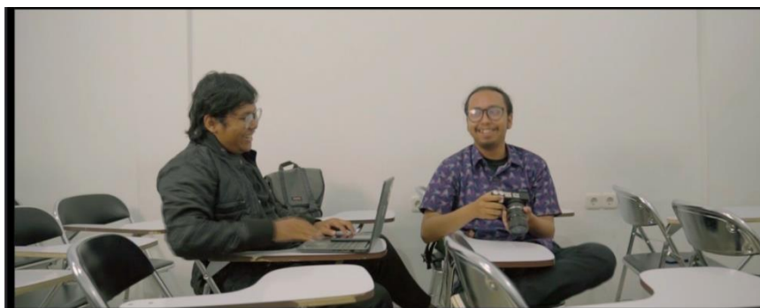
Gambar IV.3 SCENE 9 Pada Film “Kanvas Terakhir”

Ritme gerak kaluna yang melihat ke arah tara, perlahan tersenyum, dan akhirnya tertawa dengan penuh kebahagiaan, memberikan gambaran yang indah tentang ekspresi emosi positif. Dalam adegan ini, gerakan perlahan kaluna tersebut mengarahkan perhatiannya pada tara, mengekspresikan antusiasme dan kegembiraan. Pertemuan mata mereka memberikan kedalaman emosi, dan saat dia perlahan tersenyum dan kemudian tertawa, ekspresi wajahnya berubah menjadi cerah dan riang. Tertawanya dengan gemericik riang menunjukkan kebahagiaan yang murni dan tulus. Ritme gerak yang penuh perasaan ini memberi penekanan pada momen kebahagiaan yang dihadirkan oleh karakter wanita tersebut, dan menjadikan adegan ini menyentuh hati penonton, mengajak mereka merasakan kebahagiaan yang terpancar dari karakter tersebut. Dengan demikian, ritme gerak aktor kaluna membawa kehangatan dan kegembiraan ke dalam adegan, menciptakan momen dramatis yang memikat dan mengesankan bagi penonton. Berdasarkan uraian tersebut dapat disimpulkan bahwa ritme pada scene 11 telah sesuai dengan teori yang dinyatakan pada bab 2.