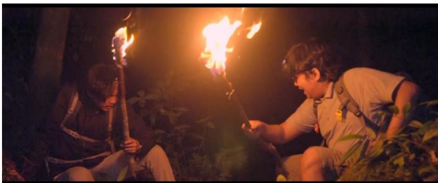
Gambar IV.5 SCENE 28 Pada Film “Kanvas Terakhir”

Ritme menegangkan dalam sebuah film adalah cara yang digunakan untuk membuat penonton merasa tegang dan cemas selama menontonnya. Ini dicapai dengan musik yang mendebarkan, adegan-adegan yang dramatis, dan situasi-situasi yang menantang. Ketika penonton terlibat dalam ritme ini, mereka merasa seperti mereka ikut serta dalam peristiwa-peristiwa dalam film tersebut, sehingga menciptakan pengalaman yang mendebarkan dan tak terlupakan.