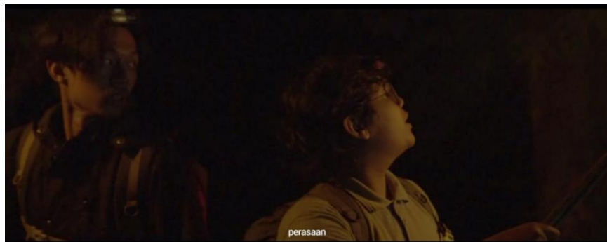
Gambar IV.13 SCENE 27 Pada Film “Kanvas Terakhir”

penonton untuk bernapas atau merenung. Sebaliknya, tempo yang lebih lambat dapat menciptakan ketegangan dengan cara yang berbeda, memungkinkan untuk pengembangan karakter yang mendalam atau untuk menggambarkan ketegangan yang terus-menerus membesar seiring berjalannya waktu.