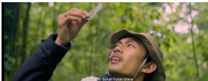
SCENE 17 Pada Film “Kanvas Terakhir”

Terlihat ritme dari ekspresi Jaka yang kehilangan sinyal sesaat ketika mobil mereka mogok di sebuah tempat asing yang tidak mereka ketahui. Kondisi langit yang semakin gelap mengintensifkan perasaan ketidakpastian, dan suara-suara hutan yang misterius membuat suasana semakin mencekam. Dalam kegelapan yang semakin mendominasi, Jaka merasa terisolasi dan rentan, tanpa cara untuk mencari pertolongan atau menghubungi dunia luar. Ritme ketakutan ini mencerminkan kebingungan dan kecemasan mereka dalam situasi yang semakin memburuk, memaksa mereka untuk mengeksplorasi dan berhadapan dengan ketidakpastian di tempat yang tak dikenal pada kondisi yang semakin suram.