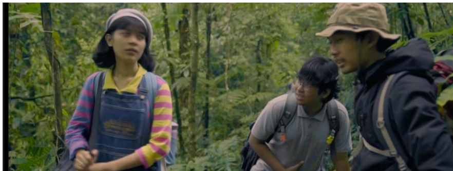
Gambar IV.15 SCENE 24 Pada Film “Kanvas Terakhir”

Tempo dalam film mampu memperlambat waktu untuk membiarkan perasaan takut merayap di dalam benak penonton. Dalam ritme ini, setiap detik terasa berharga, dan setiap adegan menjadi momen yang menggigilkan. Ini adalah cara yang efektif bagi sutradara untuk mengeksplorasi ketakutan dan menghadirkannya dengan intensitas yang luar biasa, membuat penonton merasakan perasaan takut yang mendalam sepanjang perjalanan film tersebut.