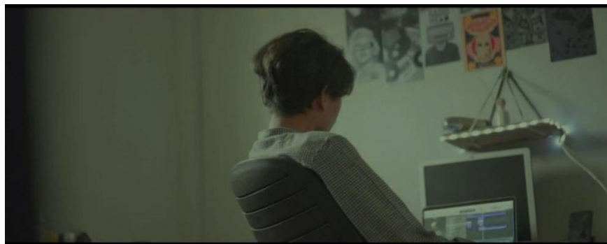
Gambar IV.17 SCENE 6 Pada Film “Kanvas Terakhir”

Ekspresi wajahnya yang penuh emosi menunjukkan kedalaman perasaan yang ia tuangkan dalam setiap bait lagu. Latar belakang kereta api memberikan sentuhan nostalgia dan petualangan, sesuai dengan tema lagu yang dinyanyikannya. Mise-en-scène yang teliti ini berhasil memperkuat karakternya sebagai seorang seniman yang mampu menghipnotis dan menggetarkan perasaan para penikmat angkringan kopi malam itu.