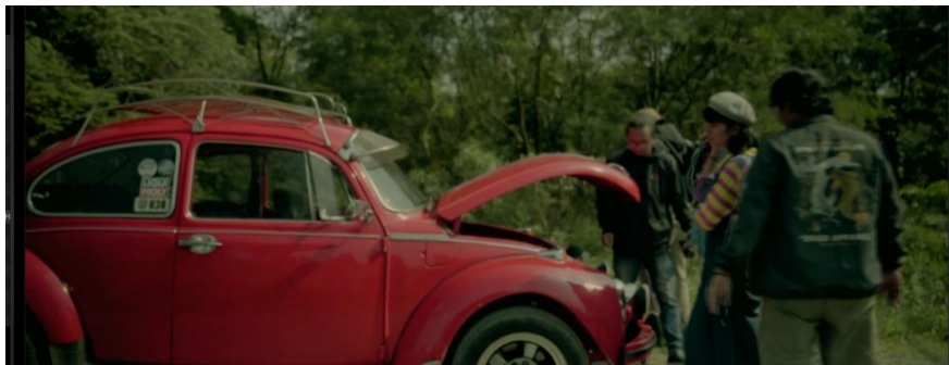
Gambar IV.19 SCENE 16 Pada Film “Kanvas Terakhir”

atau penuh kontras, bayangan yang mengancam, dan penggunaan warna gelap dapat menciptakan atmosfer yang mencekam. Ekspresi wajah karakter yang diwarnai oleh ketegangan, mata yang waspada, dan tubuh yang gemetar memberikan dimensi emosional yang mendalam. Set yang mungkin dipenuhi dengan elemen yang menakutkan, suara-suara latar yang mengerikan, dan musik yang menegangkan turut berkontribusi dalam menciptakan mise en scène yang menghantui. Dengan kombinasi semua elemen ini, mise en scène mampu membangun ketegangan dan ketakutan yang mendalam dalam adegan, mengundang penonton untuk merasakan rasa takut yang dirasakan oleh karakter-karakter dalam cerita tersebut.