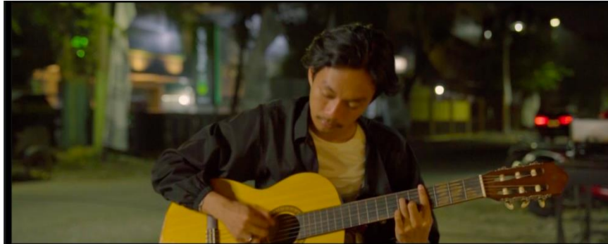
Gambar IV.11 SCENE 7 Pada Film “Kanvas Terakhir”

mengajak penonton masuk ke dalam dunia karakter dan ikut merasakan perasaan yang sedang dialami, sehingga meningkatkan daya tarik dan dampak dramatis film secara keseluruhan.