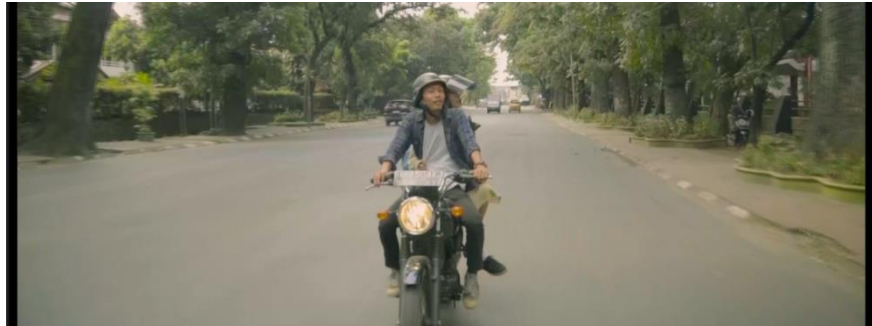
Gambar IV.12 SCENE 5 Pada Film “Kanvas Terakhir”

Tempo lambat dalam perjalanan Tara dan Kaluna di atas motor mereka menciptakan perasaan bahagia yang dalam. Mereka merasakan angin lembut yang menyapu wajah mereka, menikmati setiap momen perjalanan tanpa terburu-buru. Saat mereka berdua melintasi jalan dengan pemandangan indah di sekitarnya, waktu seolah-olah berhenti sejenak, dan mereka merasa bebas dari hiruk-pikuk kehidupan sehari-hari. Tempo yang lambat memungkinkan mereka untuk benar-benar menikmati perjalanan ini bersama, menguatkan ikatan mereka, dan menciptakan perasaan bahagia yang tulus dalam keadaan yang sederhana namun penuh makna ini. ambience suasana di jalanan yang membuat perasaan penonton membayangkan bahwa mereka berdua berada dalam kondisi hati yang bahagia.