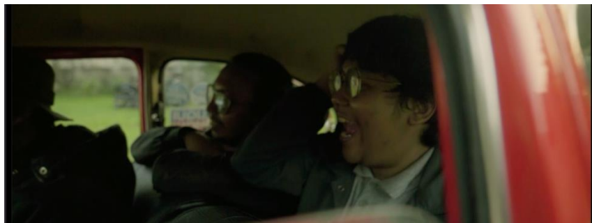
Gambar IV.4 SCENE 10 Pada Film “Kanvas Terakhir”

Dalam adegan yang menampilkan Napi dan Jaka yang terlihat sedang tertawa seraya bercanda. Dalam adegan di dalam kelas itu, ritme gerakan Napi dan Jaka mungkin tidak terlalu aktif karena mereka duduk, tetapi ekspresi wajah dan gestur tangan mereka mencerminkan kebahagiaan yang luar biasa. Dengan mata berbinar, mereka tertawa riang dan saling berjabat tangan dengan antusias. Meskipun dalam posisi duduk, gerakan mereka tetap menyenangkan, seolah-olah mereka sedang menari dalam hati mereka sendiri. Kehangatan dan keceriaan yang mereka pancarkan menjadikan momen ini sebagai puncak kebahagiaan di dalam kelas, dan semua orang di sekitar mereka merasakan getaran positif dari ritme gerakan mereka yang penuh sukacita.