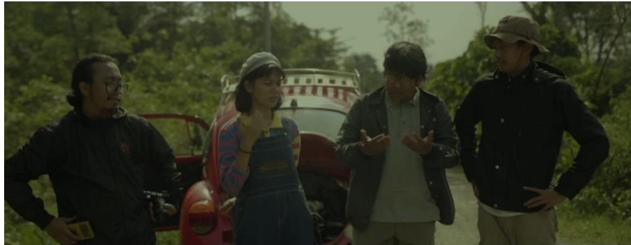
Gambar IV.20 SCENE 15 Pada Film “Kanvas Terakhir”

mengundang penonton untuk terlibat sepenuhnya dalam dunia film dan menyampaikan pesan-pesan emosional secara efektif.