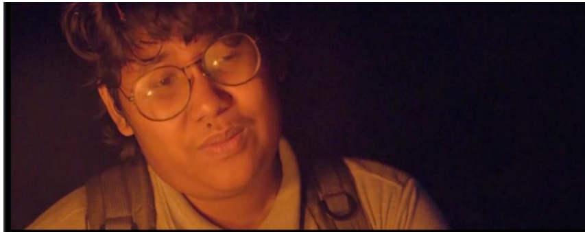
Gambar IV.6 SCENE 29 Pada Film “Kanvas Terakhir”

memecah ritme lari mereka dan memberikan nuansa misterius yang tak terduga. Dalam momen itu, ritme cerita berubah menjadi ketegangan yang menyelimuti suasana, memikat penonton untuk terus menyelami peristiwa yang penuh dengan kejutan.