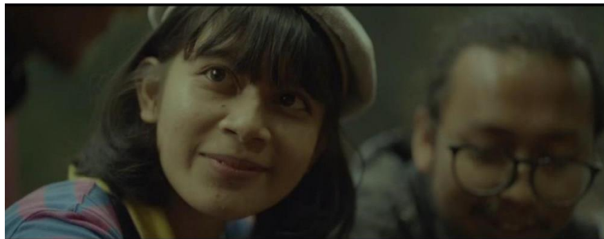
Gambar IV.1 SCENE 11 Pada Film “Kanvas Terakhir”

Film mampu menciptakan suasana yang menggugah perasaan positif, ketika penonton terhubung dengan cerita dan tokoh-tokoh dalam film tersebut, mereka akan merasakan ritme kebahagiaan yang mengalir seiring perkembangan alur cerita, mengundang mereka untuk turut merasakan kebahagiaan yang ada dalam dunia film tersebut. Dengan ritme ini, film menjadi alat yang kuat untuk menyebarkan kebahagiaan dan membagikan momen-momen yang tak terlupakan dengan penontonnya.