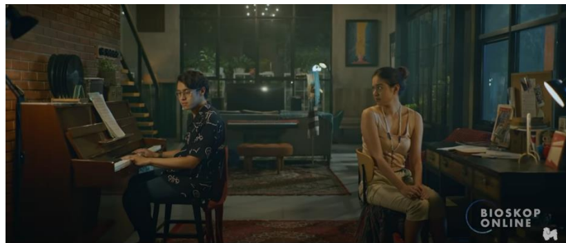
Gambar I.3 Story Of Kale 2020 (Sumber Youtube.com diakses pada 1 desember 2022)

Hingga pada hari yang tak biasa, Dinda tiba-tiba ingin menyudahi hubungan dengan Kale. Meski awalnya Kale merasa berat. Namun, akhirnya keduanya pun memilih menjalani hidup masing-masing, layaknya orang asing. Film ini menjadi referensi karena ada sedikit persamaan dalam karakter yaitu pada film “Kanvas Terakhir” tara merupakan seorang musisi yang pernah memiliki wanita, yang membedakan ialah wanita tersebut pergi meninggalkan tara karena ia tak ingin kembali dengan penyakit mental nya.