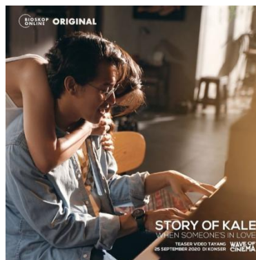
Gambar I.2 Poster Story Of Kale 2020 (Sumber Imdb.com diakses pada 1 desember 2022)

Film ini menceritakan tentang seorang tokoh bernama Kale yang bertemu dengan Dinda. Setelah bertemu beberapa kali, Kale mulai merasa jatuh hati pada Dinda. Sampai akhirnya, Kale menginginkan menjalin kasih dengan Dinda, bukan hanya sekedar teman biasa. Kale pun meyakinkan Dinda bahwa dia akan membahagiakannya dan akan memenuhi segala keinginannya jika terus bersama-sama. Keduanya pun berusaha untuk memberikan yang terbaik. Mereka berusaha