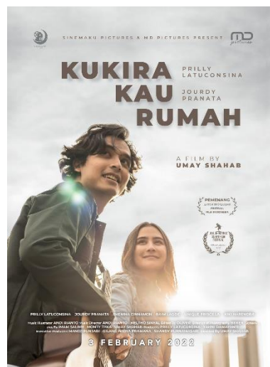
Gambar I.1 Poster Film Ku Kira Kau Rumah 2021