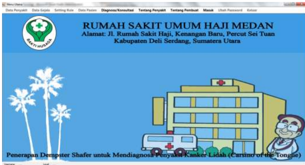
Gambar IV.2. Tampilan Form Utama

Form ini muncul setelah admin berhasil memasukkan username dan password dengan benar. Pada tampilan ini, terdapat banyak menu yang memiliki fungsi memanggil form lainnya dalam program. Gambar tampilan form utama dapat dilihat pada gambar IV.2.