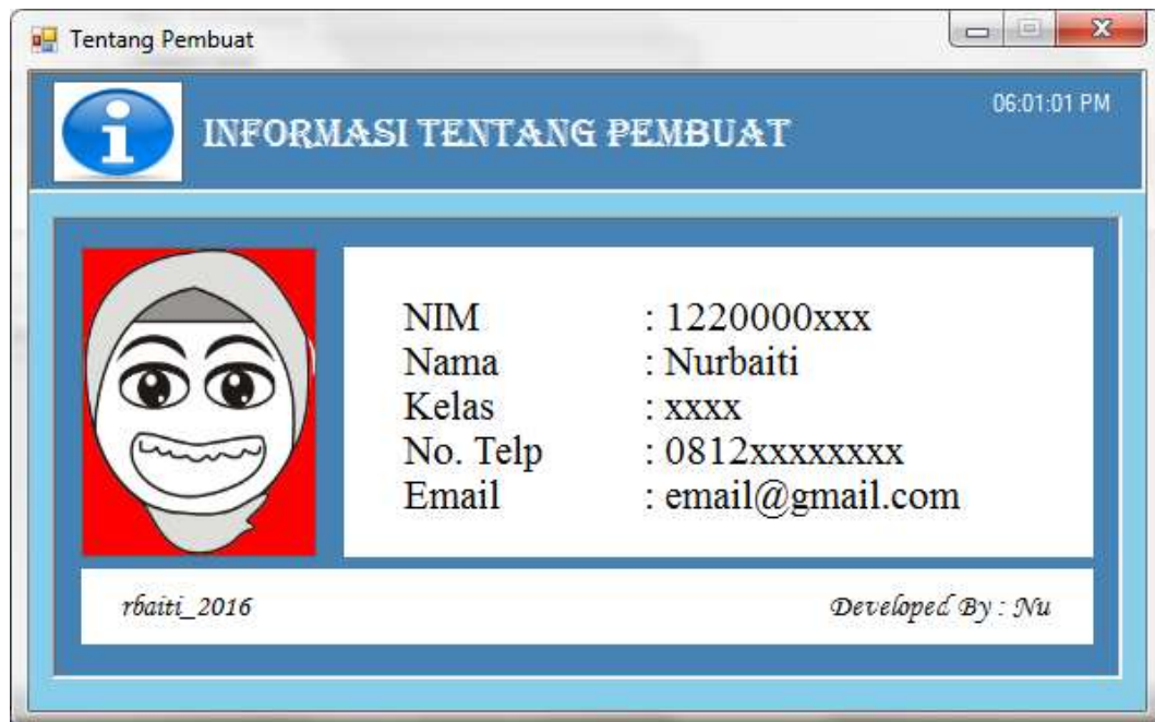
Gambar IV.13. Tampilan Form Penulis