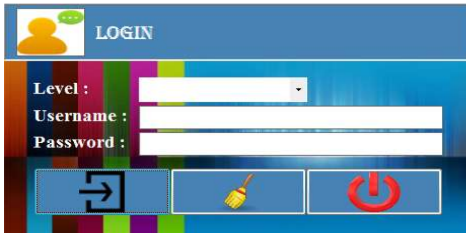
Gambar IV.1. Tampilan Form Login

Tampilan login merupakan tampilan yang pertama kali muncul ketika program dijalankan. Berfungsi sebagai form input level, username dan password admin. Gambar tampilan login dapat ditunjukkan pada gambar IV.1.