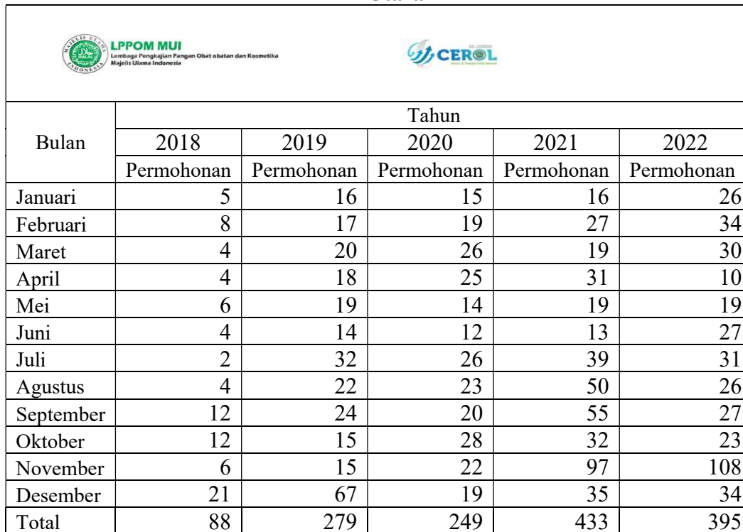
Tabel 1.1 Daftar Permohonan Sertifikat Halal Produk Makanan Provinsi Sumatera Utara