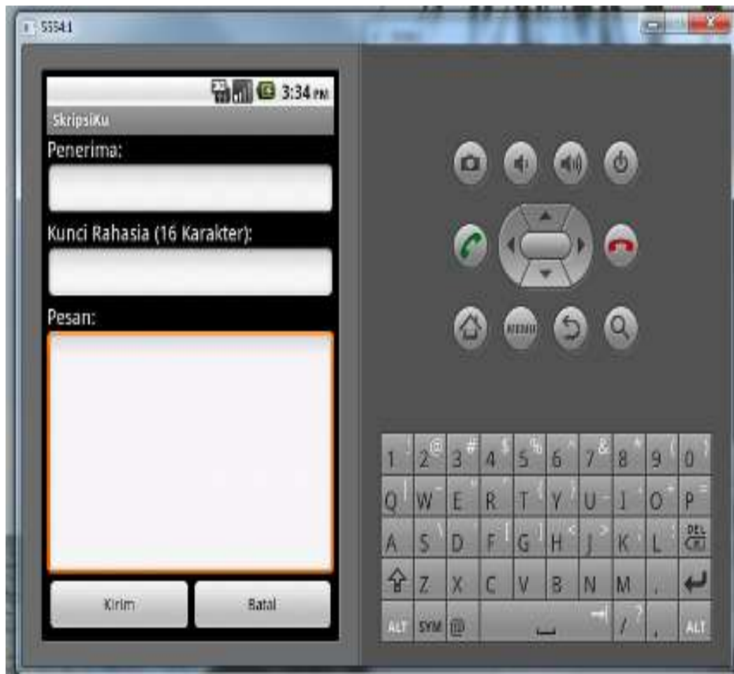
Gambar IV.1 Tampilan Form Penulisan Pesan