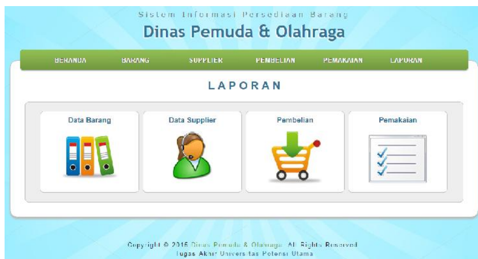
Gambar IV.10. Halaman Laporan

Halaman ini ialah halaman laporan yang tersedia mulai dari laporan data barang, laporan data supplier, laporan pembelian dan laporan pemakaian. Adapun hasil tampilan tersebut dapat dilihat pada gambar IV.10. berikut.