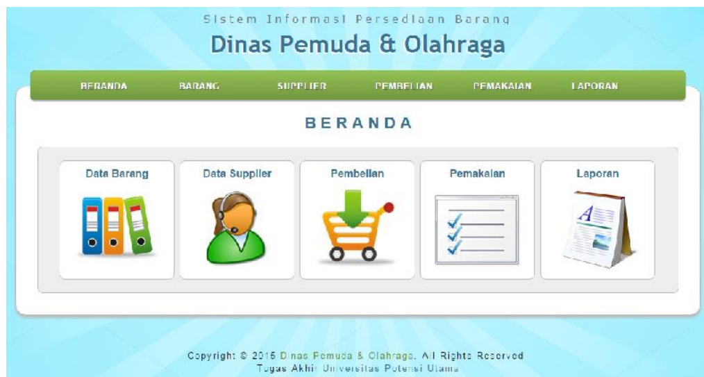
Gambar IV.2. Halaman Menu Utama

Gambar diatas ialah menjelaskan tentang pengunjung dapat memilih beberapa menu yang tertera di website yang rancang yaitu beranda, data barang, data supplier, data pembelian dan data pemakaian. Pada menu Beranda dapat menghubungkan pengguna ke database, database akan melakukan load data sehingga menampilkan data-data informasi barang. Pada menu data barang akan menampilkan halaman yang berisikan tentang Barang yang ada.