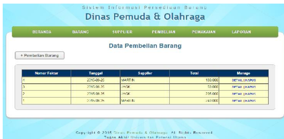
Gambar IV.6. Halaman Data Pembelian Barang

Halaman pembelian barang berisikan tentang informasi untuk dapat mengetahui informasi tentang pembelian barang yang telah dilakukan, mulai dari nomor faktur, tanggal pembelian, supplier, total pembelian yang menjadi bukti pembelian barang. Adapun tampilan tersebut dapat dilihat pada gambar IV.6. di bawah ini: