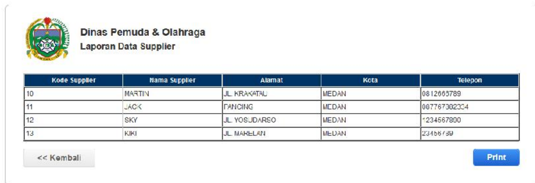
Gambar IV.12. Halaman Laporan Data Supplier

Halaman ini ialah halaman yang menampilkan laporan data. Adapun hasil tampilan tersebut dapat dilihat pada gambar IV.12. berikut.