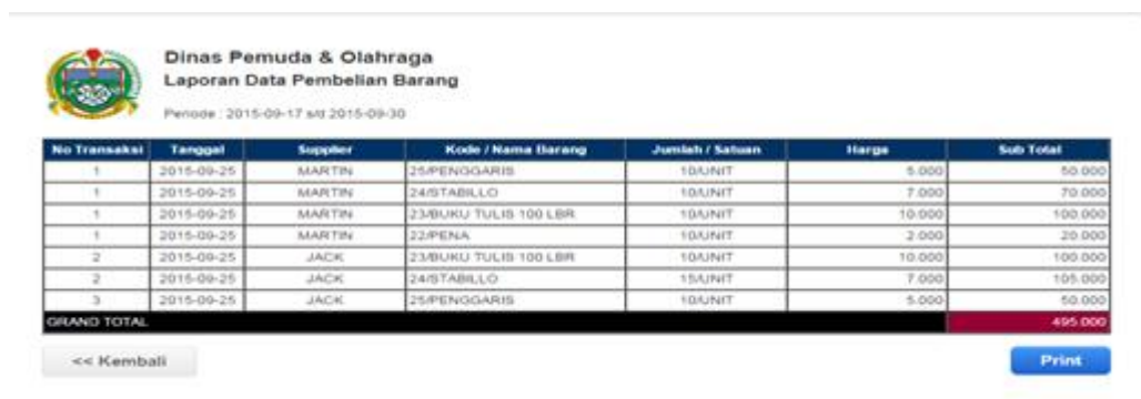
Gambar IV.13. Halaman Laporan Pembelian Per Tanggal

Halaman ini ialah halaman yang menampilkan laporan data pembelian barang per tanggal per supplier. Adapun hasil tampilan tersebut dapat dilihat pada gambar IV.13. berikut.