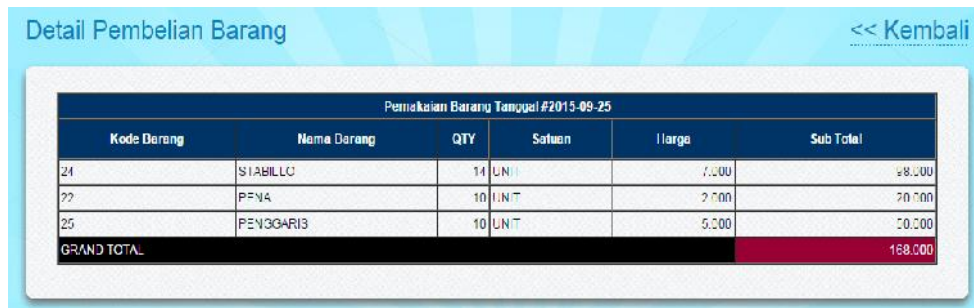
Gambar IV.5. Halaman Detail Pemakaian Barang

Halaman pemakaian barang ini berisikan tentang informasi dari tiap-tiap barang yang telah digunakan.