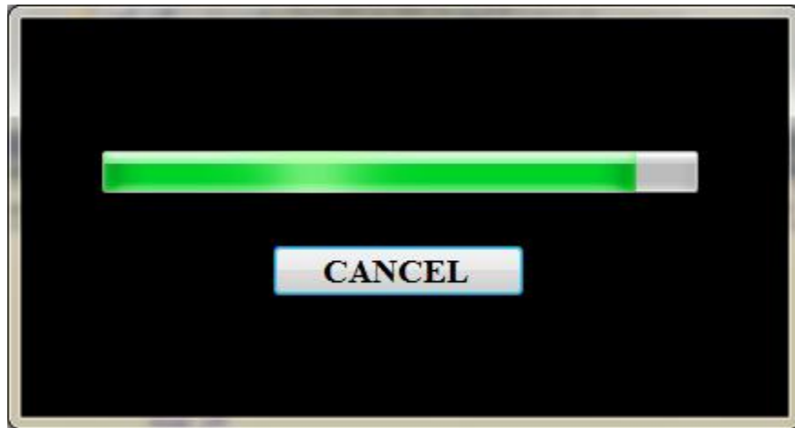
Gambar IV.1. Tampilan Form Progress