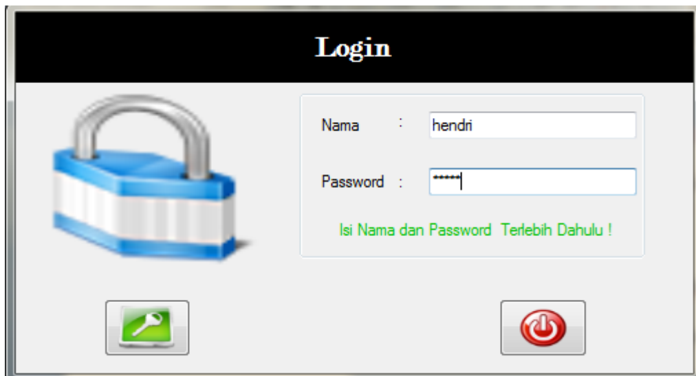
Gambar IV.2. Tampilan Menu Login

Program kemudian melanjutkan dengan menampilkan menu login sebagai validasi user . Tampilan login di tunjukkan pada gambar IV.2. berikut ini :