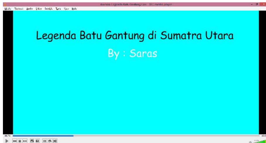
Gambar IV.1 Tampilan Awal

Tampilan ini merupakan tampilan untuk melihat keadaan awal ketika pertama kali menjalankan animasi. Adapun tampilan awal ini dapat dilihat pada gambar dibawah ini :