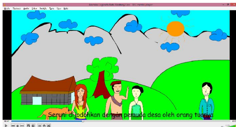
Gambar IV.3 : Tampilan Perjodohan

Tampilan ini merupakan tampilan selanjutnya setelah kita melihat tokoh utama. Adapun tampilan perjodohan dapat dilihat pada gambar dibawah ini :