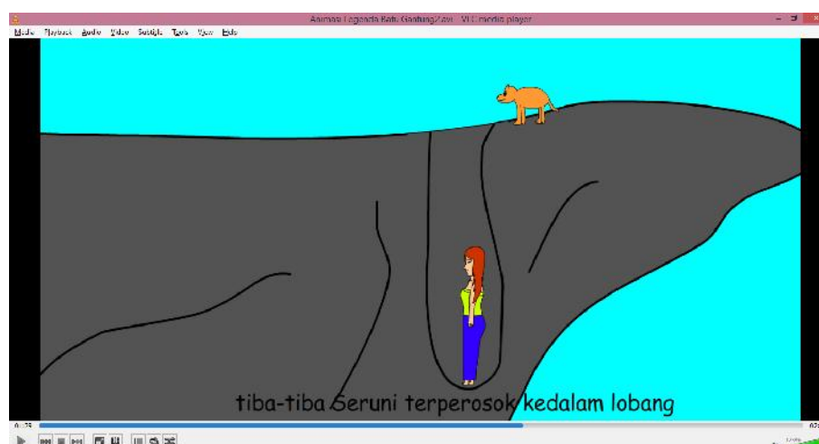
Gambar IV.5 : Tampilan Seruni Terperosok

Tampilan ini merupakan tampilan selanjutnya yang menjelaskan Seruni yang terperosok didalam lobang jurang. Adapun tampilan Seruni terperosok dapat dilihat pada gambar dibawah ini :