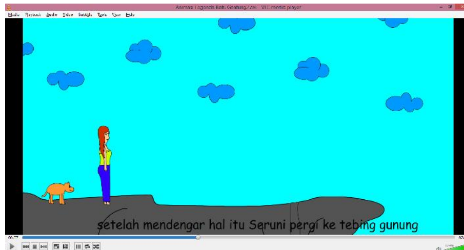
Gambar IV.4 : Tampilan Jurang

asa pergi ke jurang untuk meratapi nasibnya. Adapun tampilan jurang dapat dilihat pada gambar dibawah ini :