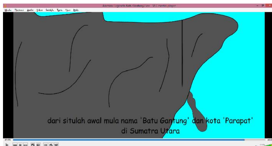
Gambar IV.7 : Tampilan Batu Gantung

Tampilan ini merupakan tampilan yang memperlihatkan batu yang keluar dan menggantung pada jurang.