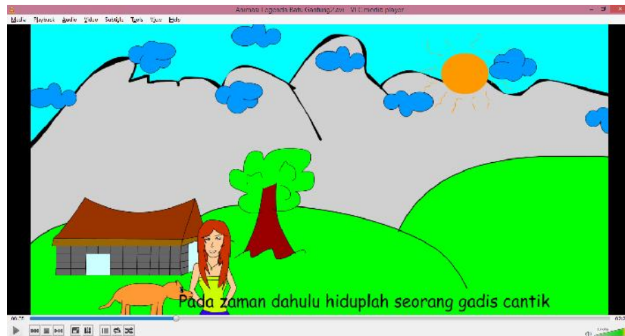
Gambar IV.2 : Tampilan Pengenalan Tokoh Utama