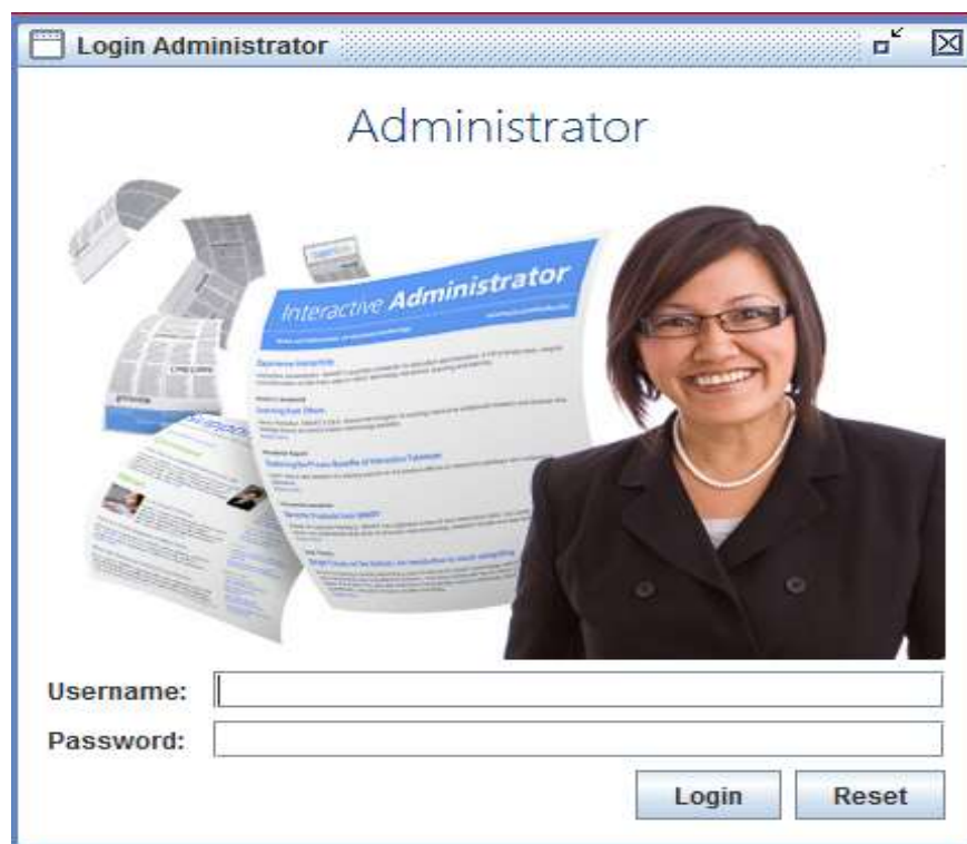
Gambar IV.2. Tampilan Form Login

Tampilan form untuk melakukan login admin dapat terlihat seperti pada gambar IV.2 berikut :