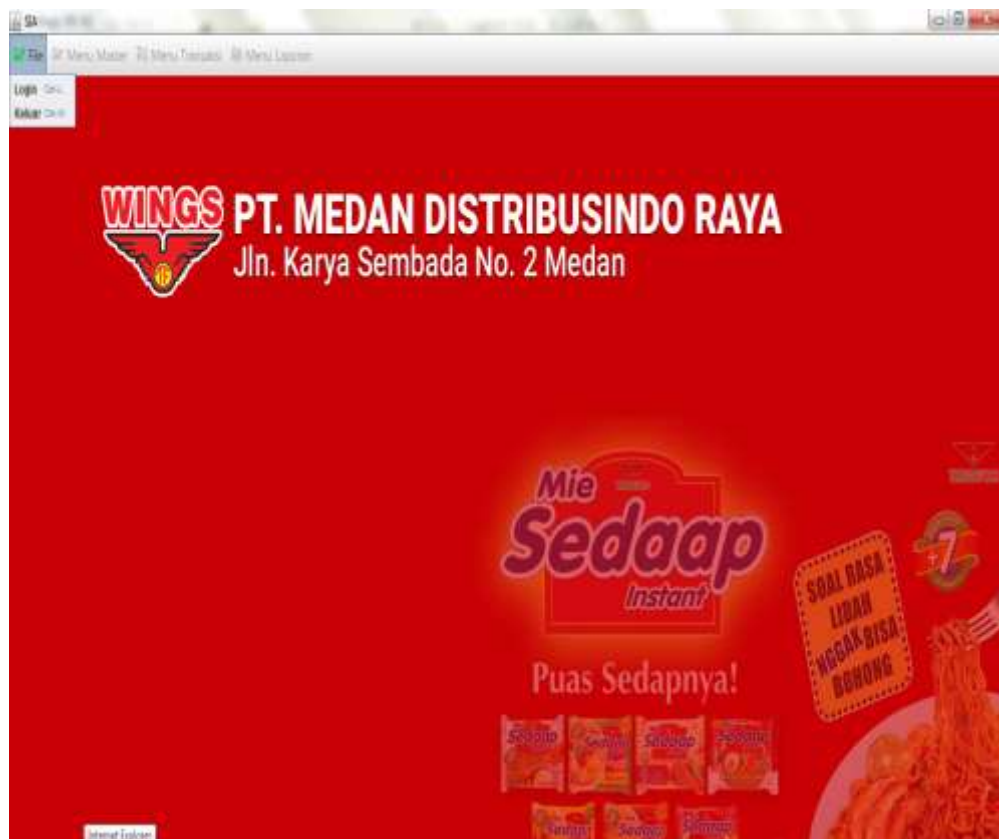
Gambar IV.1. Tampilan Form Menu Utama

Tampilan form untuk melihat menu utama dapat terlihat seperti pada gambar IV.1 berikut :