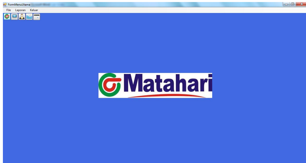
Gambar IV.2. Tampilan Form Start Up