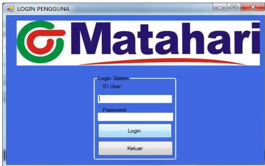
Gambar IV.1. Tampilan Form Login

Tampilan form untuk melakukan login untuk masuk pada sistem terlihat pada gambar IV.1 berikut :