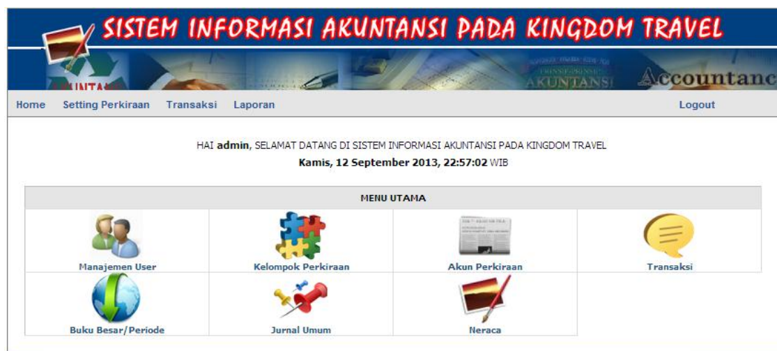
Gambar IV.2. Tampilan Menu Utama

Halaman awal berisikan menu, Manajemen User, Kelompok Perkiraan, Akun Perkiraan, Transaksi, Buku Besar/periode, Jurnal Umum, dan Neraca. Adapun bentuk tampilan menu utama seperti terlihat pada Gambar IV.2.