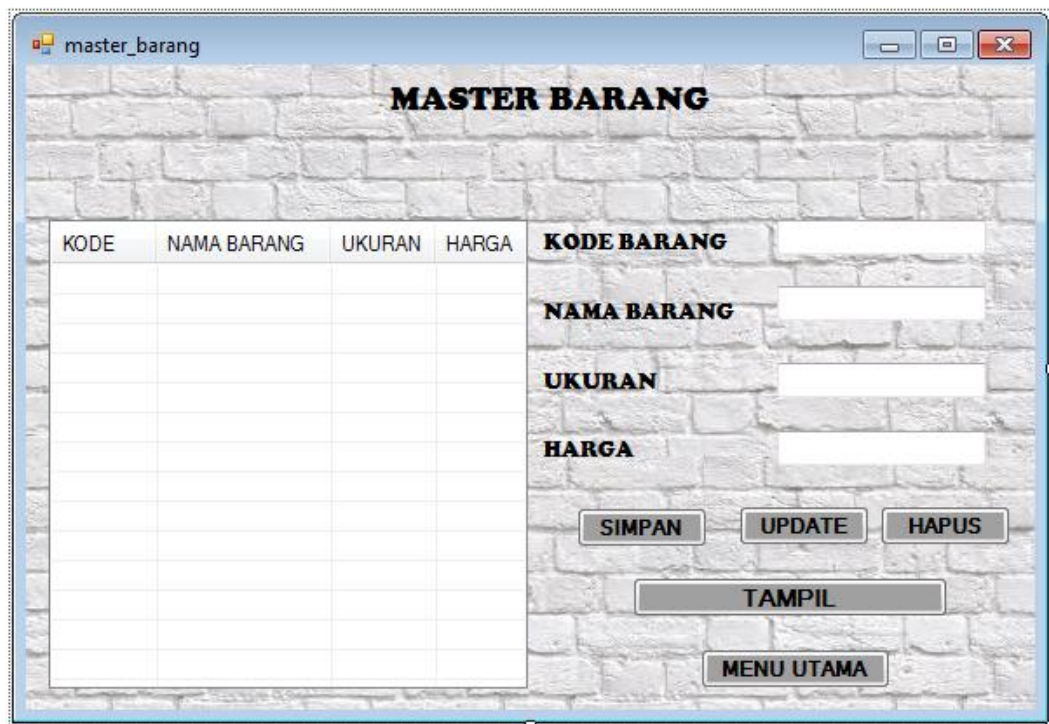
Gambar IV.3. Tampilan Form Master Barang