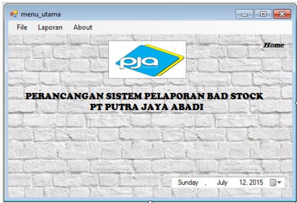
Gambar IV.2. Tampilan Menu Utama